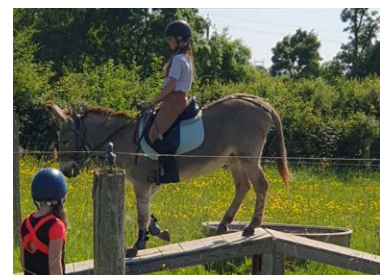
Entraînement au Moutain Trail avec Lane Cowboy

L'organisation de notre premier concours PTV (parcours en terrain varié) le 9 février au sein de notre association. Le PTV est l'une des 3 épreuves du TREC (Techniques de