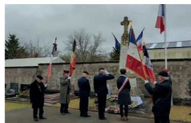
Commemoration du 5 décembre 2024

Cela ne prend que 30 minutes pour honorer nos morts qui ont combattu pour notre liberté. Nous avons tous un membre de la famille qui a combattu. Pourquoi ne pas lui dire merci par notre présence ? Venez honorer votre papi, votre mamie, un membre de votre famille, mort au combat pour défendre cette liberté que nous chérissons tant et qui fait la force de notre pays. Rendez-vous les 8 mai (fin de la Seconde Guerre mondiale), 11 novembre (armistice de la première guerre mondiale) et 5 décembre (journée nationale d'hommage aux Morts pour la France pendant la guerre d'Algérie et les combats du Maroc et de la Tunisie).