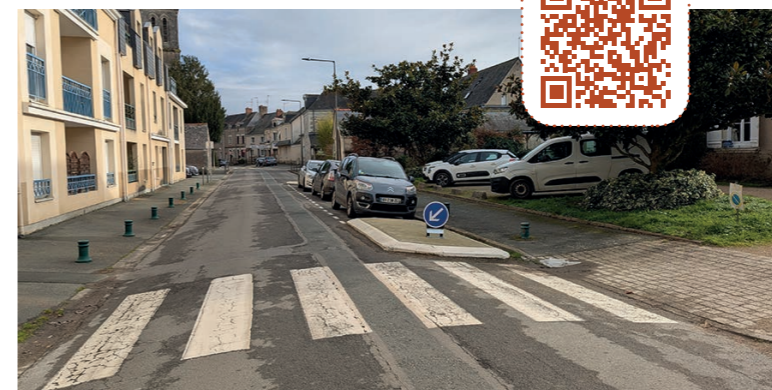
Pérennisation des places de stationnement

Vous souhaitez nous faire un retour sur ces aménagements ? Remplissez notre formulaire en ligne sur forms.office.com/e/9mUzwUzZ5N , en scannant le QR Code ci-dessous ou en utilisant sa version papier disponible à l'accueil de l'Hôtel de Ville.