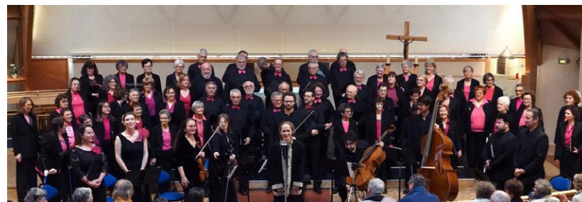
Concert en l'église Saint Gilles d'Avrillé - Mars 2025

Contact: KaléidoVox, Maison des Arts, 18 rue Pierre Lévesque, au 06 99 92 10 98 ou à chorale.kaleidovox@gmail.com