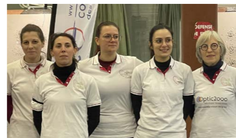
L'équipe Femme des Archers de l'Aubance

Contact: Les archers de l'Aubance, à contact@archers-aubance.fr , sur www.archers-aubances.fr ou sur Facebook : archersaubance