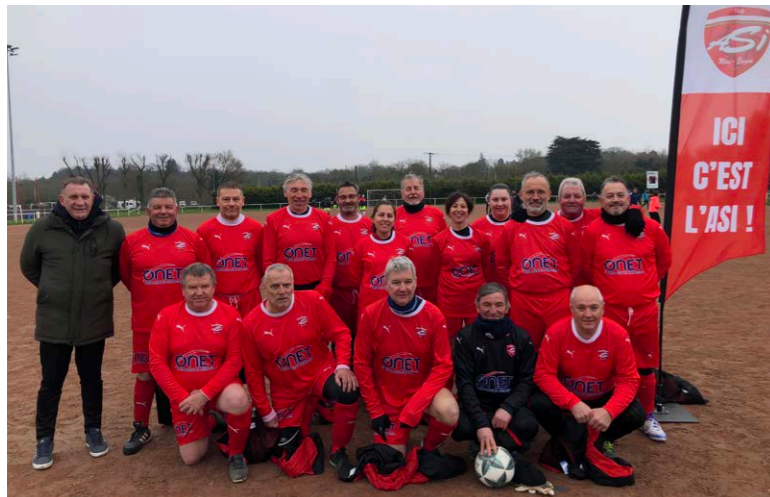
Les deux équipes de l'ASI Foot lors du critérium de Foot en Marchant

Après la réussite du loto, l'ASI Foot prépare une fin de saison haletante, sur et en-dehors des terrains : stage pour les jeunes, action avec l'Ehpad de La Buissaie, forum des métiers, tournois des P'tits U, finales départementales des Vétérans et fête de fin d'année du club.